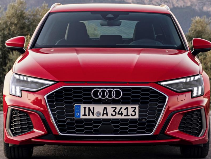
Abbildung zeigt Fahrzeug des Produktionsjahrs 2020 mit optionaler Sonderausstattung

* Audi A3 Sportback 35 TFSI S tronic, 7-Gang S tronic, 110 kW: Kraftstoffverbrauch kombiniert: 5,0-4,8 l/100 km (NEFZ) bzw. 6,2-5,6 l/100 km (WLTP) ; CO 2 -Emissionen kombiniert: 114-109 g/km (NEFZ) bzw. 140-127 g/km (WLTP)